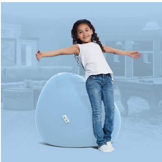
▼PALE BLUE (パールブルー)