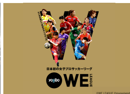
日本初の女性プロサッカーリーグ「WEリーグ」