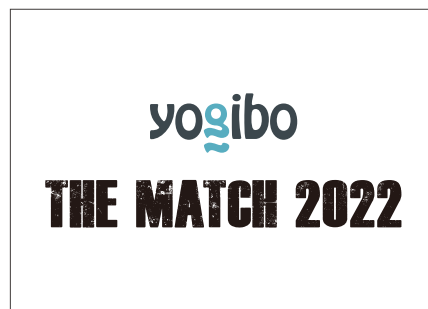
総合格闘技イベント「THE MATCH 2022」