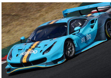
Yogibo Racing 2022 参戦車両

Yogibo は「Yogibo Racing」として『Fanatec GT World Challenge Asia Powered by AWS』へ参戦。また、日本初の女性プロサッカーリーグ「WE リーグ」、プロ e スポーツチーム「REJECT」や日本初開催のアクションスポーツ大会「X Games Chiba 2022」、格闘技イベント「Yogibo Presents THE MATCH 2022」などへの協賛を行っております。さらに聴覚や視覚など感覚過敏の症状がある人でも安心して落ち着いた環境でスポーツ観戦を楽しむことができる「センサリールーム」のプロデュース・普及活動、被災地への支援活動や持続的な社会課題の解決を共に目指す「TANZAQ(タンザク)」プロジェクトなど、社会への貢献を通して“ストレスのない社会を実現する”ことを目指し活動しております。