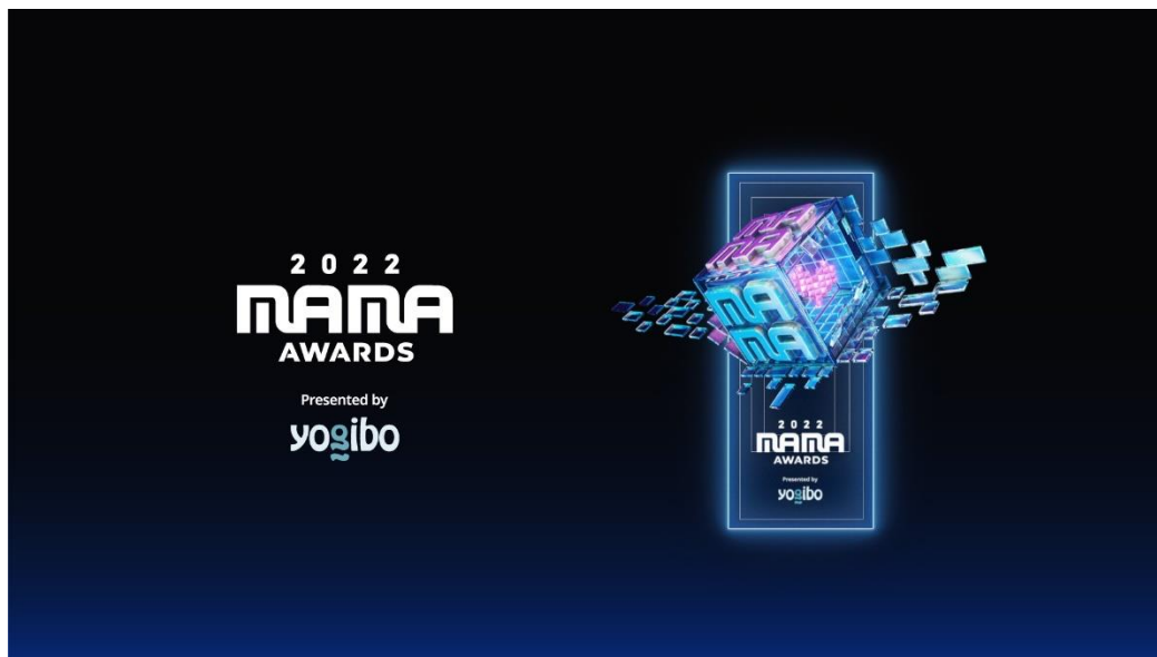
コンポジットロゴ