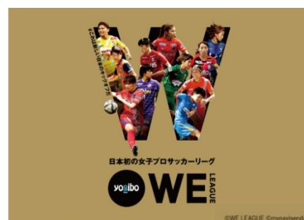
日本初の女性プロサッカーリーグ「WE リーグ」