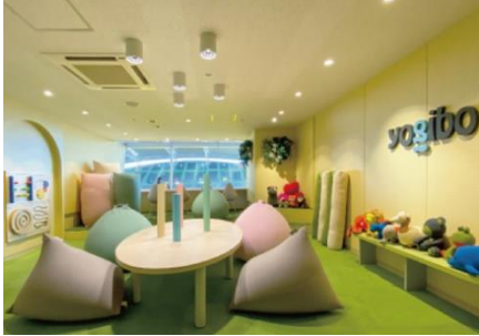
安心してスポーツ観戦できる「センサリールーム」

Yogibo social good 「TANZAQ（タンザク）」： https://tanzaq.jp/