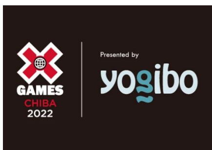
日本初開催のアクションスポーツ大会「X Games」