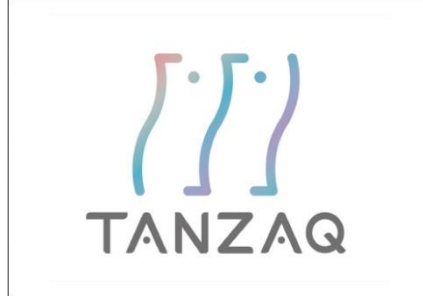
持続的な社会課題解決を目指す広告「TANZAQ」