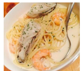
海老と牡蠣のクリームパスタ