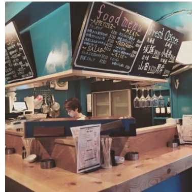
牡蠣ベロ渋谷店 店内

この度提供を開始する「蒸し牡蠣&焼き牡蠣食べ放題コースメニュー」では、牡蠣そのものの味はもちろん、牡蠣との相性の良い食材との食べ合わせや牡蠣の美味しさを存分に引き立てた料理を楽しんでいただければと考え、ご提供をさせていただくことになりました。