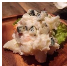
ブルーチーズのポテサラ