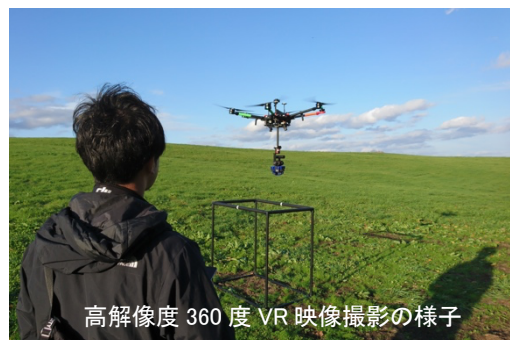
高解像度360度VR映像撮影の様子

弊社は、高画質VR撮影から大型機空撮など様々な案件に対応可能な撮影機材を各種(ALTA X+ Insta360TAITAN、DJI Matrice600Pro+360RIZE)取り揃えており、今後も各種イベント、観光事業の強化へ貢献してまいります。