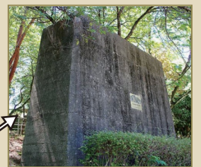
架橋演習の橋脚跡 高さ4m幅5m奥行2m