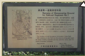
鉄道第一連隊演習所跡・解説板