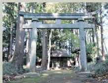
分城跡にある妙見神社