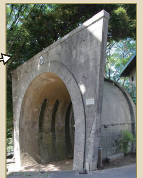
隧道（トンネル）工事跡 高さ6m幅6m奥行5.5m