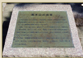
荒木山の由来・解説板

鉄道第一連隊演習所は、現在の千葉公園綿打池付近から競輪場付近の一角にあり、架橋演習に使用したコンクリート製の橋脚や、トンネル工事演習に使用したコンクリート製ドームのほか、ウインチ台といわれるコンクリート塊などがあり、昔日の面影を今に伝えている。