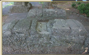
ウインチ台とされるコンクリート塊