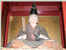
佐賀県小城市光勝寺に祭られている千葉胤貞像