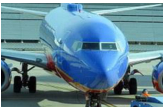
航空機内カーペット、椅子のスチームケアを実施