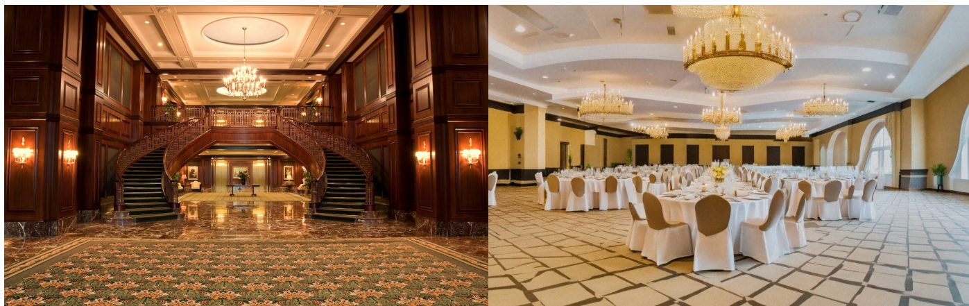
ホテルロビー、宴会場イメージ

株式会社ニッセンテクノ メール nissentechno777@gmail.com TEL: 03-3667-0041