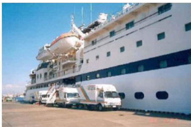
客船内のカーペット、椅子、ソファのスチームケアとコンサルティングを実施

ニッセンテクノは今後も、ハイブランドホテル、病院、教育施設などの人が集う場所ならびに、客船、航空機などの乗り物で、現場の課題に対応しながら、効率性と高品質な衛生管理を両立するサービスを提供いたします。そのことにより、そこに集う人々にとっての安心、安全確保、ウェルビーイングの実現に寄与します。