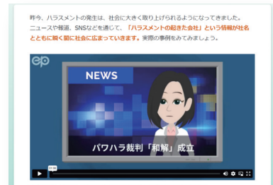
- 教材内画面イメージ -

「ハラスメント行為者が自分の言動に無自覚な場合、ハラスメント防止研修の内容が行為者に届いているかわからない」という声をもとに、「無自覚な行為者」を意識した内容を追加いたしました。パワハラリスクのセルフチェックや、行為者が自分の言動を見直すきっかけをつくるために重要なことの解説を通じて、教育担当者がより活用したいと思っていただけるような内容を盛り込んだ教材になっています。