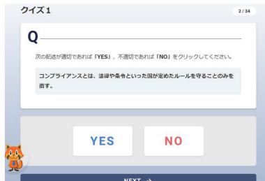
- 教材内画面イメージ -

Q&A形式の教材で取り組みやすい構成です。さらに最後の確認テストは全問正解することを学習修了の要件として設定しているため、理解度の確認と知識の定着が見込めます。