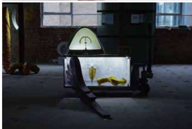
Zijing Rie Ye