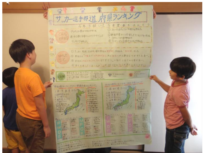
左：選手数のカウントはJリーグとなでしこリーグをそれぞれが担当 右：できあがったランキングに2人とも大満足