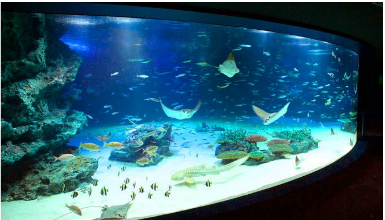
サンシャイン水族館1F「大海の旅」の中央にある、人気の大水槽「サンシャインラグーン」

被験者9名（女性3名、男性6名）にウェアラブルタイプの心拍センサを装着してもらい、「入館前」「入館中」「入館後」の自律神経機能を測定。主に緊張やストレス時に働く「交感神経」の数値をグラフ化することで、水族館の癒し効果を自律神経の観点から検証しました。