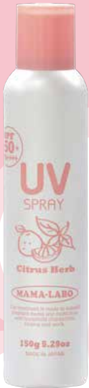
ママラボ UV マルチスプレー M 150g