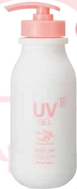
ママラボ UV ジェル F 280g