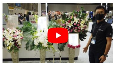
フラワーメッセージの紹介