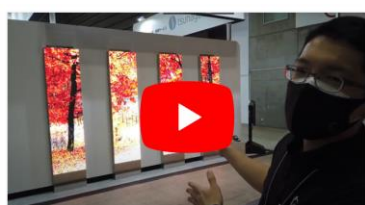
アスカLEDビジョントールの紹介