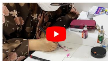
なまえ文の実演動画