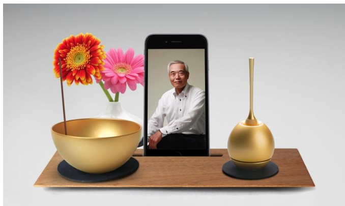
スマートチェリング（ゴールド）

別売りの手元供養三具足「スマートチェリング」なら、どんな住環境にも溶け込みます。各種カラーを取り揃えております。