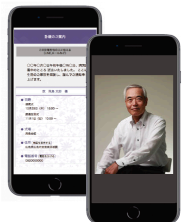
モデルはイメージです

訃報のWebページは「供物」「供花」「弔電」「香典」の注文画面と連携しているので、スムーズにご注文いただくことができます。