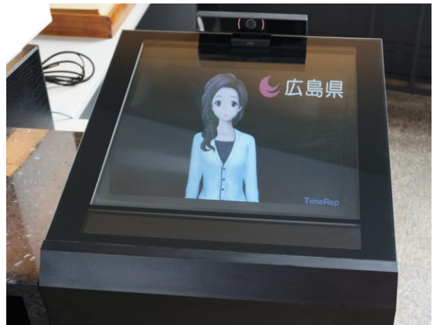
デジタルサイネージ (庁内案内システム)