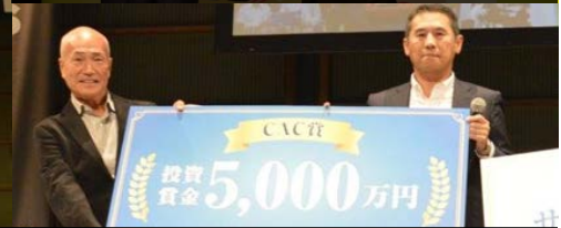
CAC賞 投資賞金5000万円を獲得したメビオール