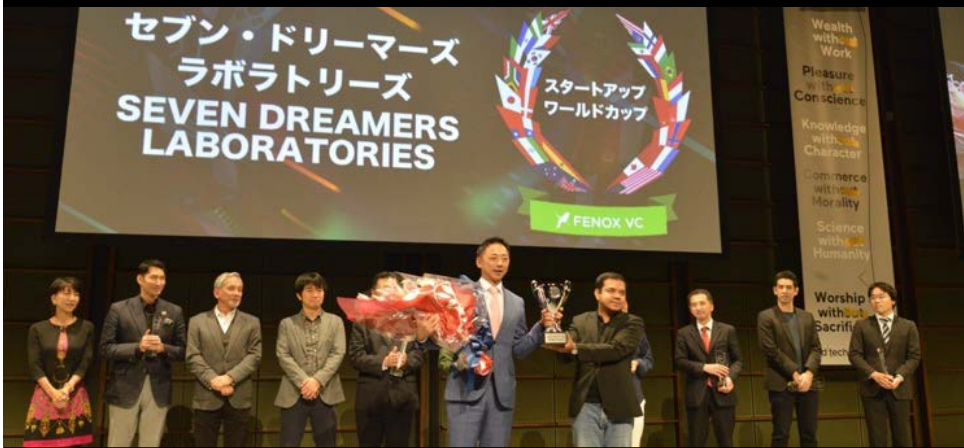
日本代表 Seven Dreamers Laboratories