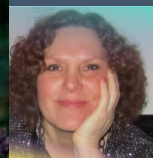
デニス・セイント・ アーナルト