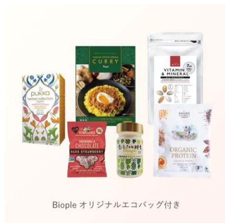
Biople オリジナルエコバッグ付き

【Biople 東京ミッドタウン八重洲店 オープニングキット】 (フード) ¥3,240 (税込)