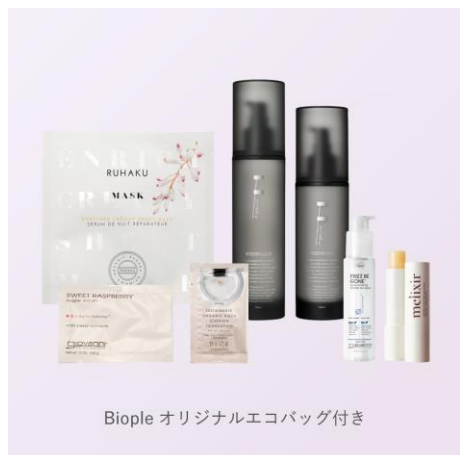
Biople オリジナルエコバッグ付き

人気商品の中からバイヤーが厳選したアイテムを集めたキットを数量限定でご用意いたします。