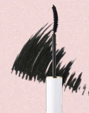
ロング ラッシュ マスカラ 01 : black