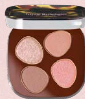
ベタル フロート アイパレット EX12 : hitoyasumi