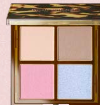
レイヤード ベタル パレット EX01 : sakaime