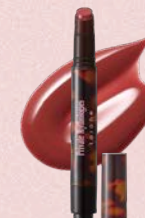
メルティング タッチ リップ EX01 : yorimichi