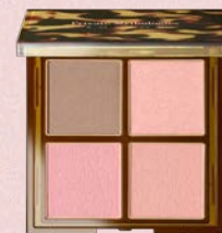
レイヤード ベタル パレット EX02 : kasanari