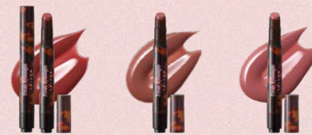
トーン メルティング タッチ リップ