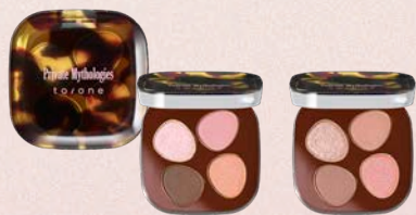
トーン ペタル フロート アイパレット