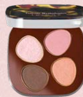
ベタル フロート アイパレット EX11 : asobi