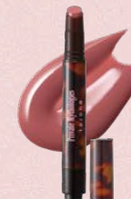
メルティング タッチ リップ EX03 : matane