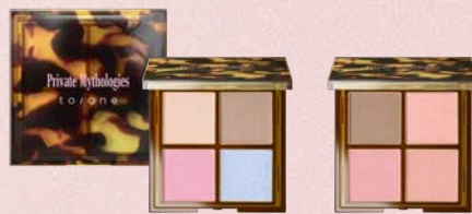
トーン レイヤード ペタル パレット