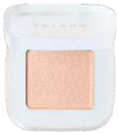
ベタル フロート ルミナス アイズ 01 Ethereal Glow