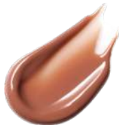
EX02 Slow Emotions

コージーな愛らしさを感じる ほのかな赤みで 唇にやさしいぬくもりを灯す アプリコットベージュ