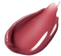
EX04 Mild Plum

かすかな青みを秘めた 澄んだ血色感が やわらかい華やぎをもたらす ロージーピンク