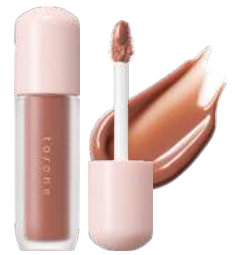
ベタル グロウ ルージュ EX02 Slow Emotions

to/one PR 柴山・布川 | MAIL pr@toonecosmetics.com