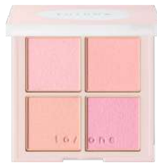
レイヤード ベタル パレット EX04 Warm Harmony