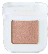
ベタル フロート ルミナス アイズ 03 Fluffy Nude