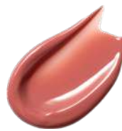
EX03 Sunday Blanket

落ち着いた彩度で 唇を端正に際立たせ エフォートレスな空気を纏う シナモンベージュ