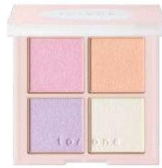
レイヤード ベタル パレット EX03 Layered Petal