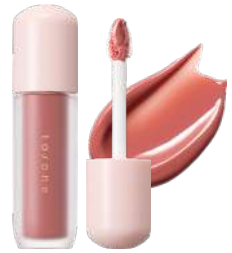
ベタル グロウル ルージュ EX03 Sunday Blanket

to/one PR 柴山・布川 | MAIL pr@toonecosmetics.com