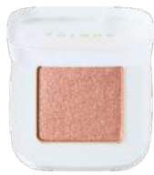
ベタル フロート ルミナス アイズ 04 Muted Terracotta