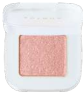
ベタル フロート ルミナス アイズ 02 Cozy Evening