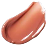
EX01 Apricot Coral

コージーな愛らしさを感じる ほのかな赤みで 唇にやさしいぬくもりを灯す アプリコットベージュ