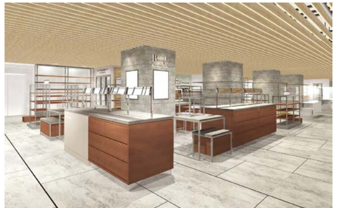
Biople by CosmeKitchen 店内イメージ