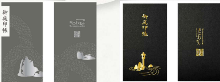
お庭印帳制作イメージ