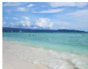
上)ホワイトビーチ 右)ラドハンガービーチ