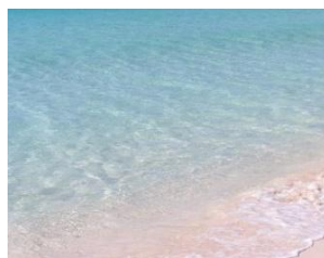
左)与那覇前浜ビーチ 下)日本のベストビーチで見る 夕日は絶景