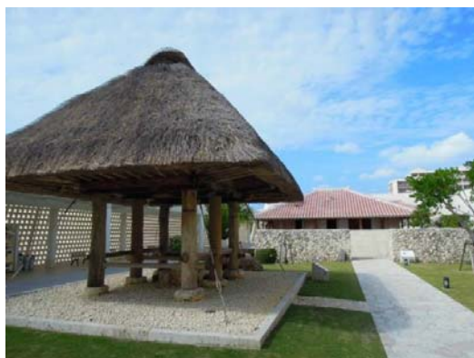
沖縄県立博物館・美術館