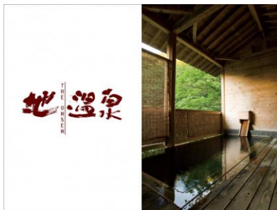
JR 東日本：「地・温泉」に利用できる びゅう商品券

6月はキャンペーン第2弾として、合計 95名 の方に東京メトロ、CITIZEN、JR東日本、JR西日本、JR九州など5社から旅行券や宿泊券、時計などの豪華なプレゼントが当たります。皆さんのいつか「きっと行く」旅のリストをシェアして、素敵な旅のプレゼントをゲットしてください。