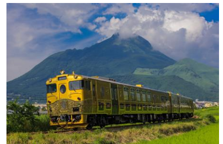
JR 九州：JRKYUSHU SWEET TRAIN「或る列車」ペア乗車券

トリップアドバイザーの「旅リスト」は、気になる場所、観光スポット、レストラン、宿泊施設をまとめて保存できる便利な機能です。各施設のページに掲載されているハートのアイコンをタップするだけで、簡単に旅行のアイデアや計画を保存でき、URL やメモなども保存・入力できます。さらに、保存した施設を地図上で一覧表示できます。