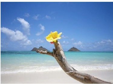
上) 1位の「ラニカイビーチ」 下) 2位の「ホワイトヘブンビーチ」