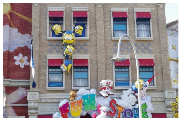
【ユニバーサル・スタジオ・ジャパン】