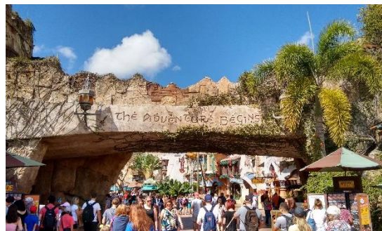
【アイランズ・オブ・アドベンチャー】