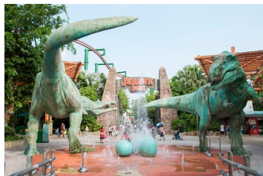
【ユニバーサル・スタジオ・シンガポール】