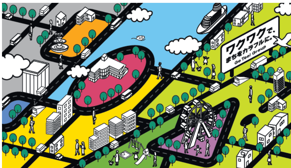
「Go Too! Group」キービジュアル

このビジョンは、新たなキービジュアルにも体現されています。カラフルなロゴマークそのものが一つのまちを賑やかに形成するキービジュアルは、そこに住まう方々や訪れる方が楽しい気分になるような、まち全体をワクワクさせていきたい想いを具現化したものです。Go Too! Groupがこれから自動車ディーラー業に限らず、様々な事業を展開し、まちを盛り上げていく存在であることをイメージさせます。