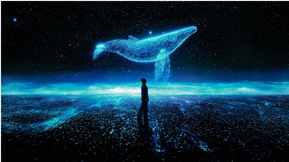
▲ BEACH NIGHT BEING (NEW YORK)

また直近では、本年韓国ボーイズグループのBTSとのコラボレーションを実現し、音楽界の新たな没入体験の取り組みでも世界中に名を広めています。