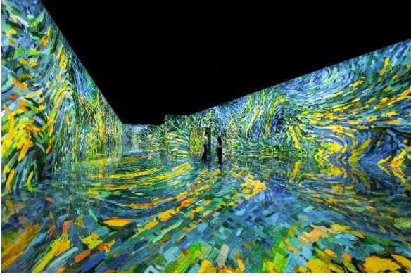
▲GARDEN 'D'ORSAY (GANGNEUNG, NEW YORK)