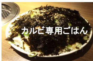
カルビ専用ごはん