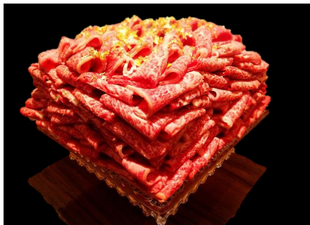
黒毛和牛ザブトン