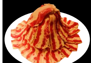
ファミリーカルビ