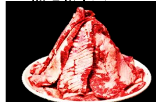
上カルビステーキ