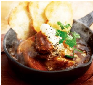
5時間煮込んだ牛ほほ肉