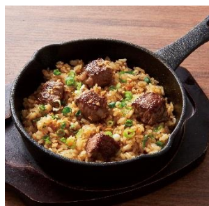
熟成大麦牛のガーリックライス※

熟成された赤身の旨みたっぷりなステーキ。 土間土間の肉料理の中でも特に人気の高いメニューです。