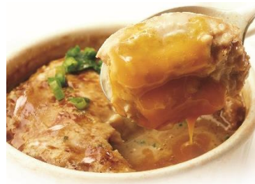
とろーりチーズつくね