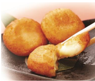
もちもちチーズもち

2017年9月12日から提供しているチーズメニュー。9月、11月開催のフェアでは、チーズメニューの中で圧倒的人気を誇った人気No.1メニュー。今回のフェアでも引き続きお楽しみいただけます。