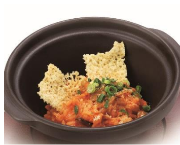
キムチチーズリゾット※