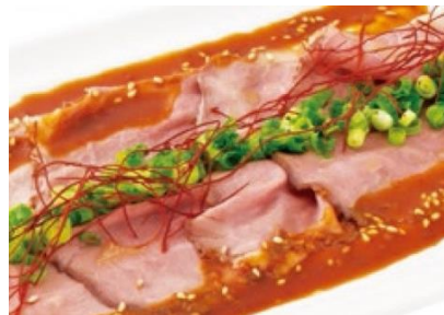
ローストビーフの 麻辣カルパッチョ