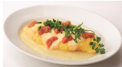
明太チーズオムレツ