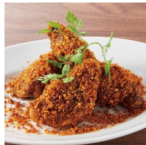
骨付き辛味チキン

熟成された大麦牛を加えたガーリックライス。赤身の旨みがたっぷり染み込んだガーリックライスはやみつきになる味に。