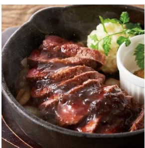
熟成大麦牛のステーキ

熟成された赤身の旨みたっぷりなステーキ。 土間土間の肉料理の中でも特に人気の高いメニューです。