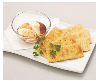
夢心地クリームチーズ