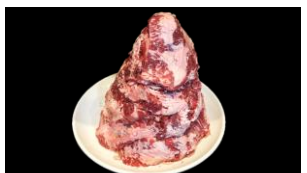
7等 カルビステーキ