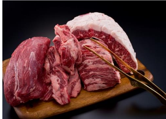
2等 ギガ肉厚牛角盛り