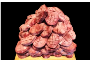
3等 霜降り上タン塩