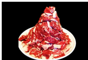
5等 上ハラミ タレ