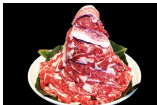
4等 黒毛和牛カルビ タレ