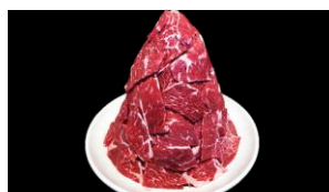
8等 ロース タレ