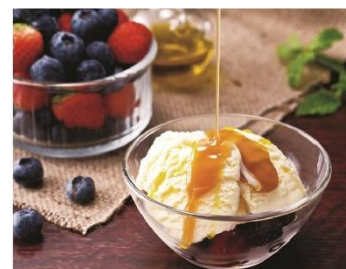
■キャラメルアフォガート