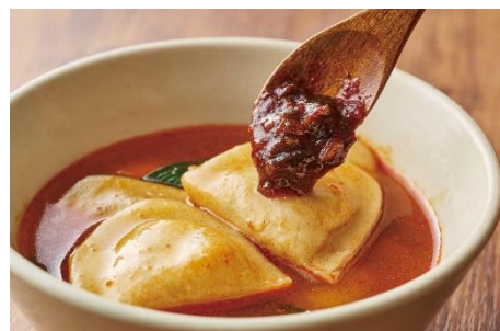
【ニラ醬麻辣湯】オススメ 「もちり水餃子」

チーズリゾットに「トマトペースト」と「バジルペースト」を加えることで、トマトの酸味とバジルの香りが広がる、イタリアン風の麻辣リゾットを楽しめます。