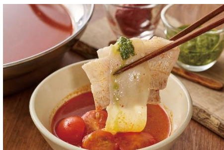
【スパイシートマト麻辣湯】オススメ 「チェリートマト」&「チーズしゃぶしゃぶ」