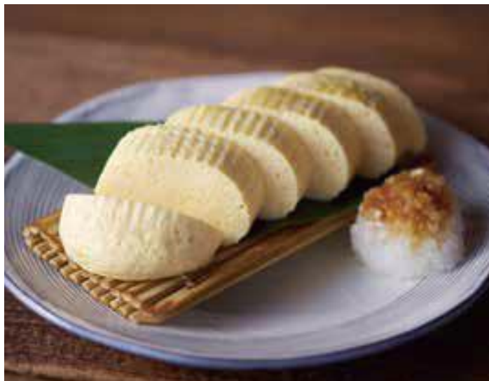
「だし巻きたまご」490円(税抜)

また、改良されただしの美味しさをダイレクトに味わっていただくための「だし巻きたまご」も考案いたしました。使用するだしが変わるのはもちろん、たまごをフライパンで焼くのではなく、釜飯を炊く専用の釜でじっくりと蒸し上げる製法をとることによって、だしの旨みと香りが外に逃げることなく、まるで茶碗蒸しのような柔らかく滑らかな口当たりで、だしの上品な香りと味わいが楽しめる商品になっております。