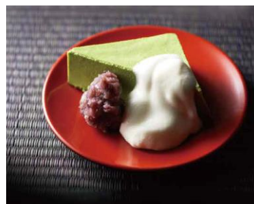
「抹茶のババロア」490円(税抜)

日本人に慣れ親しまれた抹茶の味を、ババロアやティラミスにアレンジすることで、老若男女問わず多くのお客様に楽しんでいただけるよう工夫いたしました。その他にも「クリームあんみつ」「黒蜜わらびもちアイス」など、和の美味しさを存分にお楽しみいただける和スイーツをご用意致しました。