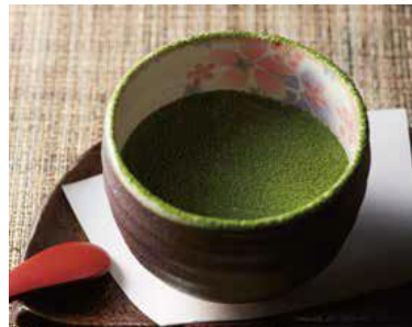
「抹茶のティラミス」430円(税抜)