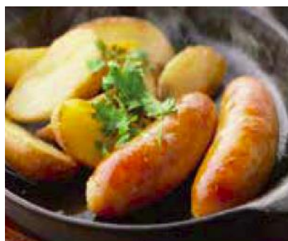
「熟成鶏のソーセージ」590円(税抜)