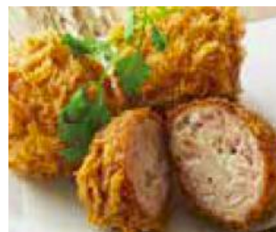
「鶏つくねのメンチ」430円(税抜)