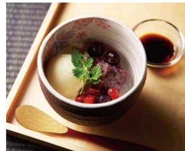
「クリームあんみつ」390円(税抜)

かまどかでは、だしや釜飯、鶏料理、甘味などを通して、「日本の食文化の素晴らしさ」をたくさんの方に提供していきたいと考えております。