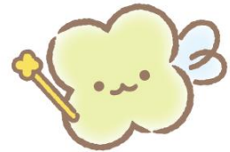
サンエックスのようせい

リラックマ、すみっこぐらし、たればんだなど、1,000を超える100%オリジナルキャラクターを生み出し続け、その不思議な魅力をオリジナルプロダクトやライセンス事業、様々なイベントやプロモーション、映像などを通じて世界中に届けています。見た目はかわいいのに、くすっと笑えるシュールさがあり、心に寄り添い包み込んでくれるような優しさを持つキャラクターたち。かわいいだけじゃないサンエックスキャラクターは多くの人々を引きつけています。