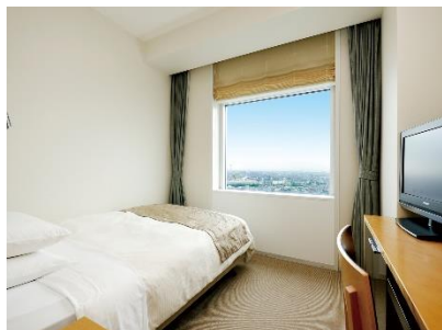
スーベリアシングル