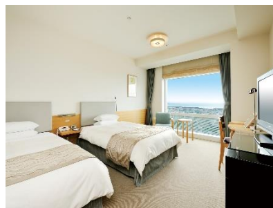
デラックスツイン