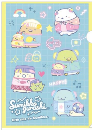
クリアホルダーセット 605円 (税込)