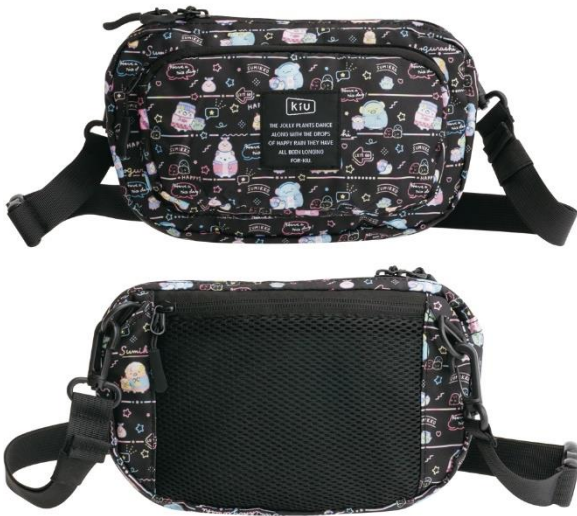
フロントポケットミニショルダーバッグ 4,400円 (税込)