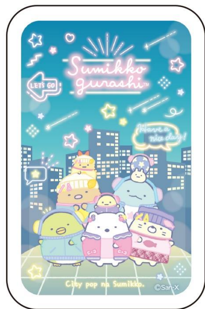
缶キャンディ 626円 (税込)