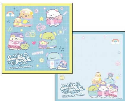
ブロックメモ 440円 (税込)