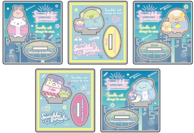
ミニアクリルスタンド (ランダム) 660円 (税込)