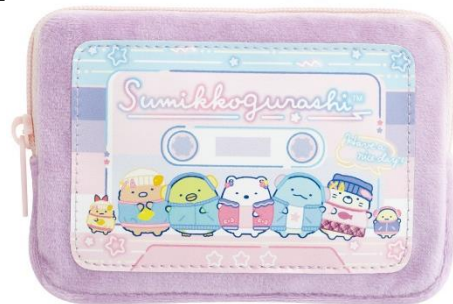
ミニポーチ 1,760円（税込）