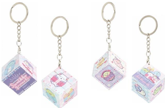
キューブパズルキーホルダー 2種 各880円（税込）