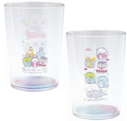
アクリルカップ 2種 各825円 (税込)