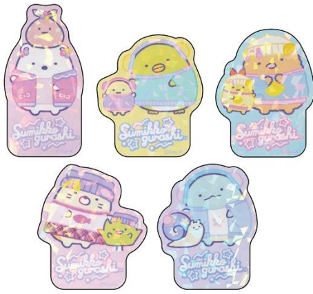
ホログラムダイカットステッカー (ランダム) 330円 (税込)