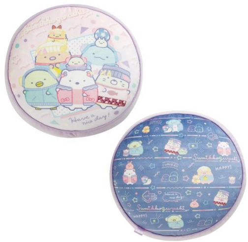
クッション 3,300円 (税込)