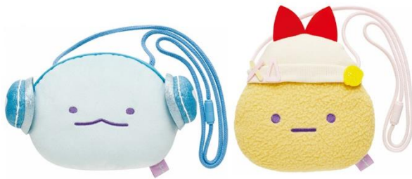
ぬいぐるみポシェット 2種 各2,200円（税込）