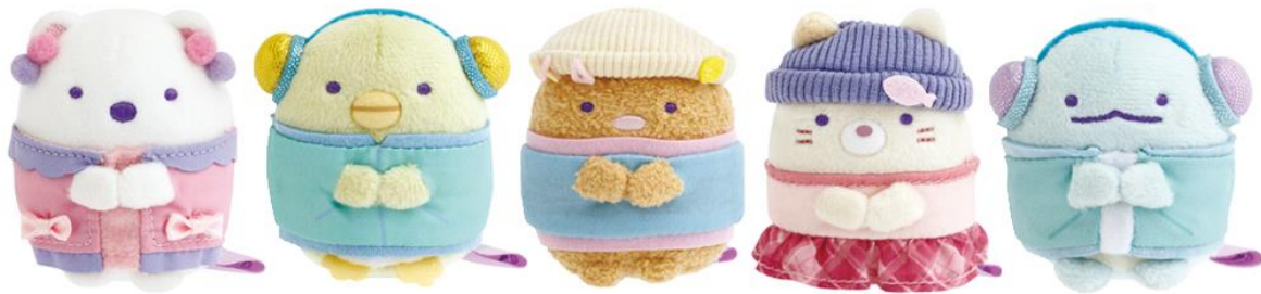
てのりぬいぐるみ 5種 各1,430円（税込）