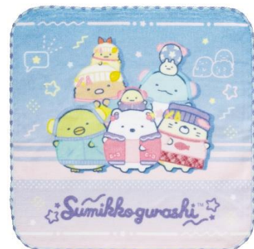
ミニタオル 825円（税込）