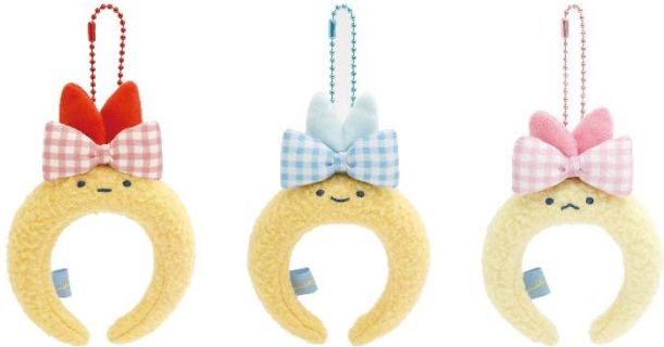
えびふらいのしっぽ あじふらいのしっぽ えびてんのしっぽ