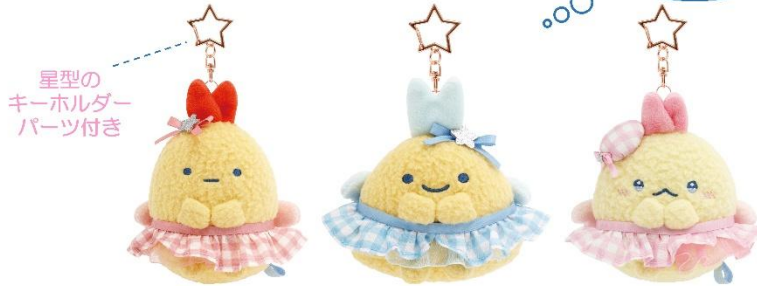
えびふらいのしっぽ あじふらいのしっぽ えびてんのしっぽ