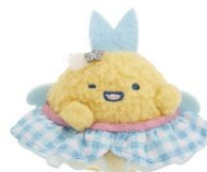
あじふらいのしっぽ