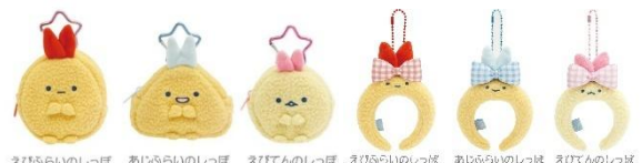
えびふらいのしっぽ あじふらいのしっぽ えびてんのしっぽ えびふらいのしっぽ あじふらいのしっぽ えびてんのしっぽ