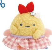
えびふらいのしっぽ