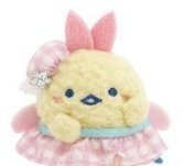
えびてんのしっぽ