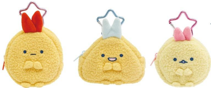
えびふらいのしっぽ あじふらいのしっぽ えびてんのしっぽ