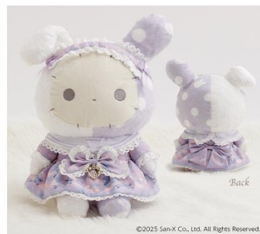
お揃いのワンピースを着たスピカ（イメージ）