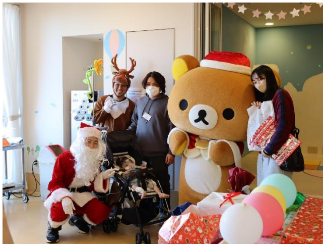
榊原記念病院での様子

「サンタパレード 2025」は 11 月 16 日（日）に東京・代々木公園イベント広場で、12 月 7 日（日）には大阪城公園で開催され、今回はその参加費を活用して子どもたちにプレゼントが贈られました。