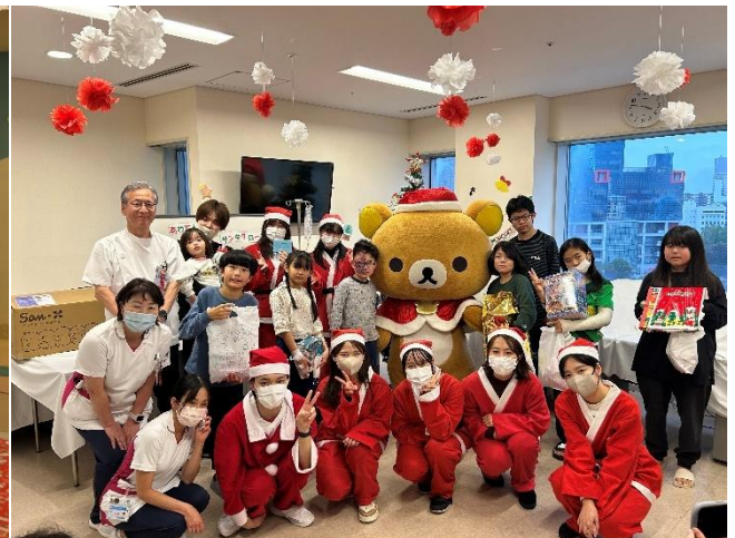
医学研究所北野病院での様子