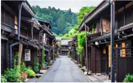
高山市内 古い町並み