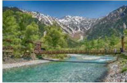
上高地・河童橋から見える穂高連邦