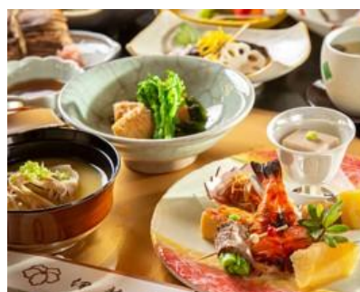
老舗料亭「伊勢幾」湖国会席(一例)