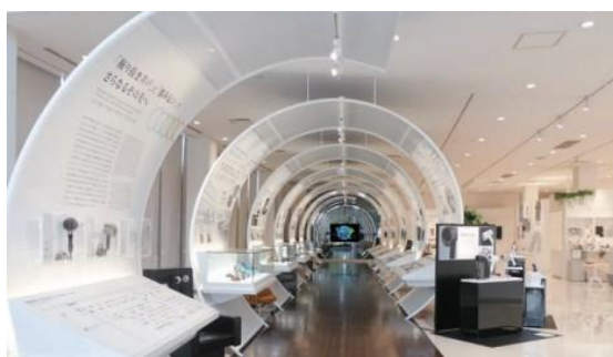
パナソニックの彦根工場内「KIZUNA 館」