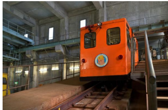
体験坑道で海面下約 140m の別世界へ！ 青函トンネル記念館（イメージ）