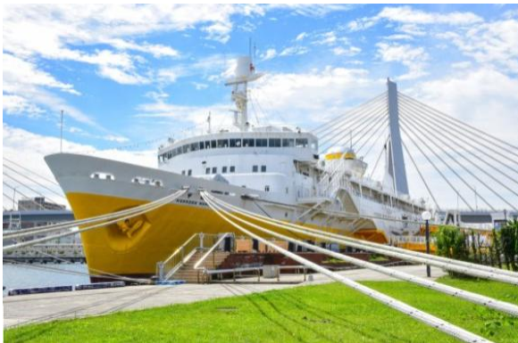
青函連絡船メモリアルシップ八甲田丸