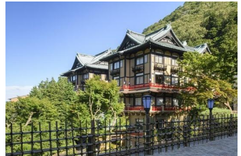
富士屋ホテル(外観)