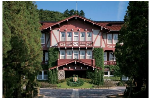
雲仙観光ホテル(外観)