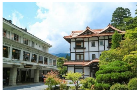
日光金谷ホテル(外観)