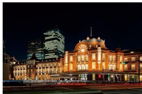
東京ステーション(外観)