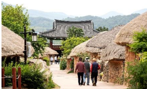
「宮廷女官チャングムの誓い」の撮影地 順天 樂安邑城