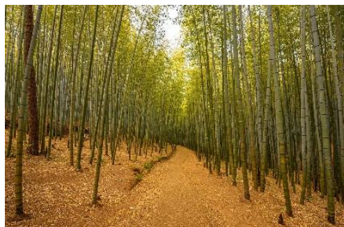
「オクニョ 運命の女」の撮影地 アホプサンの竹林