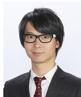
房野史典(ブロードキャスト!!) ナビゲートのオンライン講座 『超現代語訳 戦国時代』