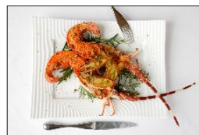
イメージ:ジョエル・ロブション