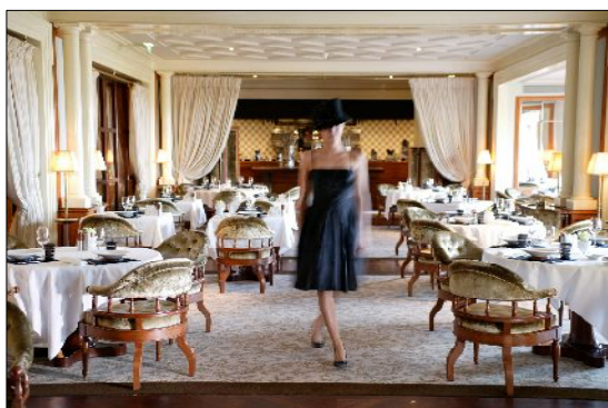
イメージ:ジョエル・ロブション

近畿日本ツーリスト株式会社（本社：東京都千代田区、社長：吉川勝久、以下、KNT）は、「ラグゼ 銀座マロニエ」（HP: http://lux.knt.co.jp ）が企画する「ラグゼ コレクション」より、『“食”の体験 モナコ「ジョエル・ロブション」クッキング・デモンストレーションとパリ7日間』の販売を8月13日から開始しますのでお知らせします。