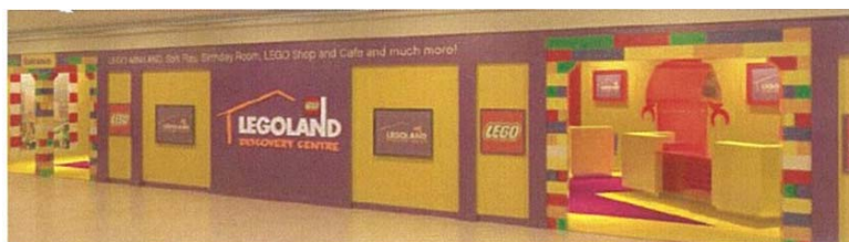
レゴランド イメージ

レゴランド・ディスカバリー・センター東京は（URL: http://www.LEGOLANDDiscoveryCenter.jp ）、「レゴランド・ディスカバリー・センター」が日本に初めて展開する屋内施設で、300万個を超えるレゴ®ブロックがいっぱいの家族が一緒に楽しめる様々な体験型アトラクションを設置しています。