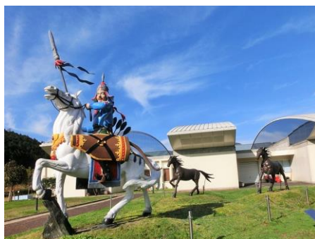
日本・モンゴル民族博物館