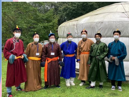
昨年の合宿の様子