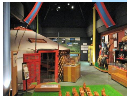
日本・モンゴル民族博物館