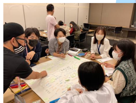
昨年の合宿の様子