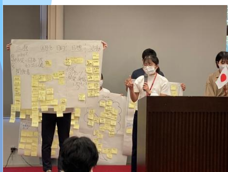
昨年の合宿の様子