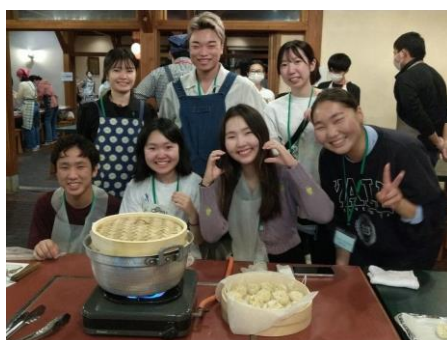
昨年の合宿の様子