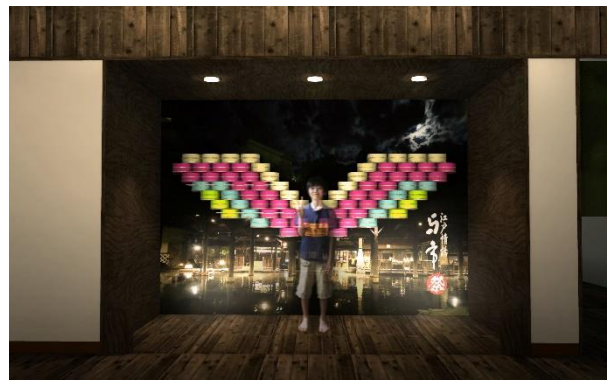
▲カラフルな桶を使ったおしゃれなフォトスポットも